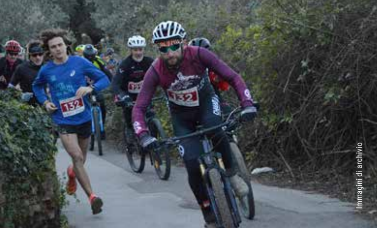
immagini di archivio