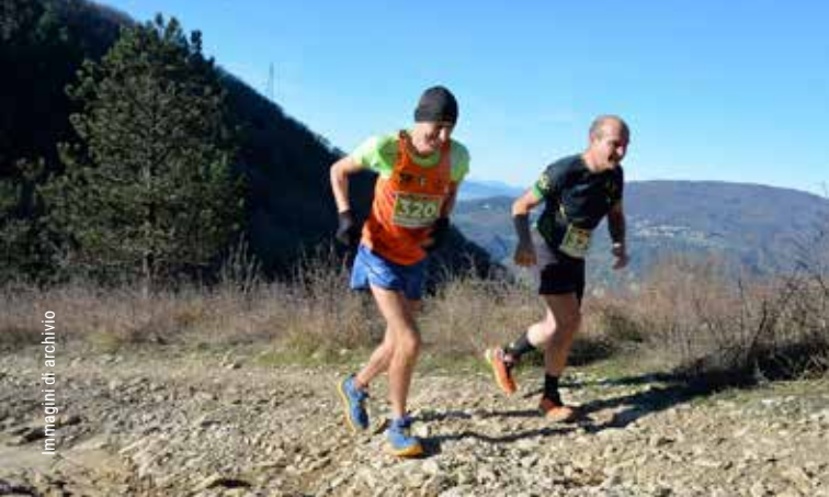
immagini di archivio